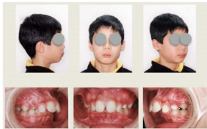
顔写真・口腔内写真