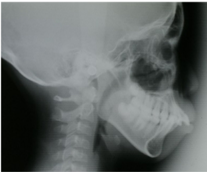
レントゲン写真（頭部：側面）